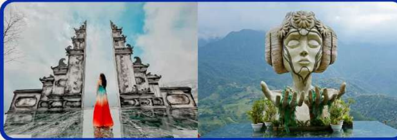
เชคอิน โมอาน่า (Moana Sapa Cafe)