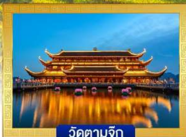
วัดตามจุก