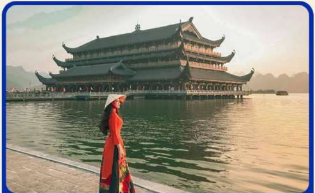
จุดเชคอินแห่งใหม่ “วัดตามจุก”