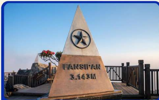
นั่งกระเช้าสู่ยอดเขาฟานซิปัน