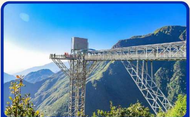
สะพานแก้วมิงกรมข (Rong May Glass Bridge)