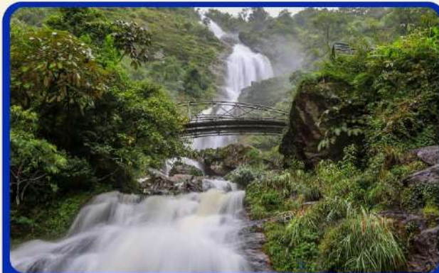
น้ำตกสีเงิน (Silver Water Fall )