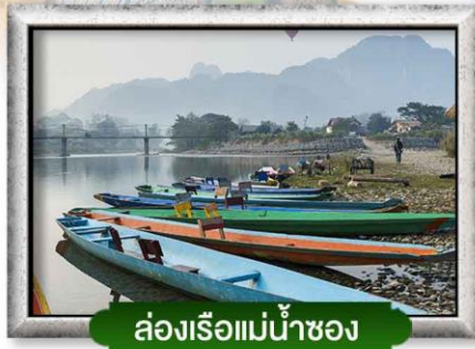
ล่องเรือแม่น้ำซอง