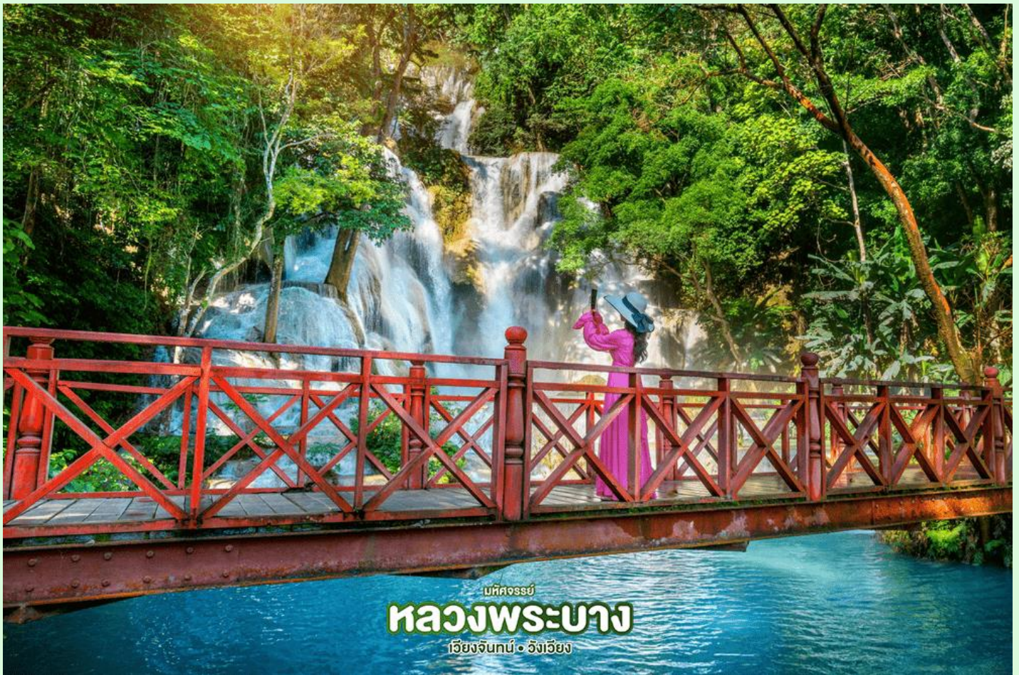
มหัสจรรย์ หลวงพระบาง เวียงจันทน์ • อังเวียง

จากนั้น นำเดินทางผ่านหมู่บ้านชนบทชมวิถีชีวิตของชาวบ้านสู่ น้ำตกตาดกวาสี (Kuang Xi Waterfall) โดยผ่านหมู่บ้านชนบทริมถนน 2 ข้างทาง เป็นหนึ่งในน้ำตกที่สวยงามที่สุดในเขตหลวงพระบาง มีแม่น้ำใสสีมรกตตลอดปี ชมความงามของน้ำตกที่ตกลงหล่นเป็นชั้นๆอย่างสวยงาม มีสะพานและเส้นทางเดินชมรอบๆ น้ำตก ให้เวลาอิสระดื่มด่ำกับธรรมชาติ และ อิสระกับการเล่นน้ำ