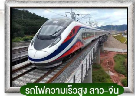
รถไฟความเร็วสูง ลาว-จีน