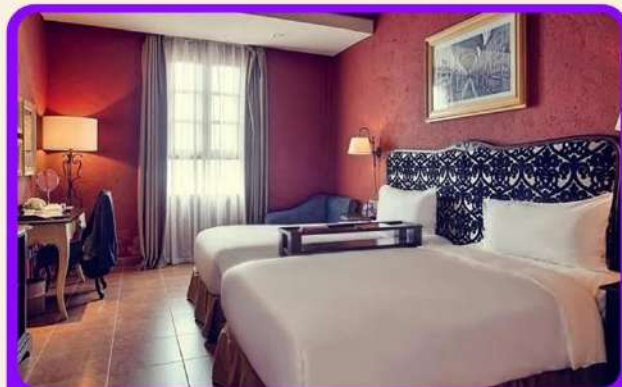
พักบนบานาฮิลล์ 1 คืน