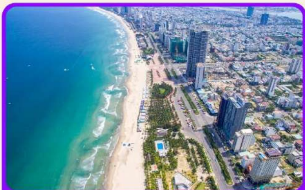
เช็किन ชายหาดหมีเคว เป็นชายหาดที่สวยงามที่สุดในเมืองดานัง