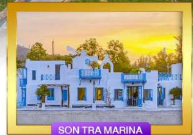
SON TRA MARINA