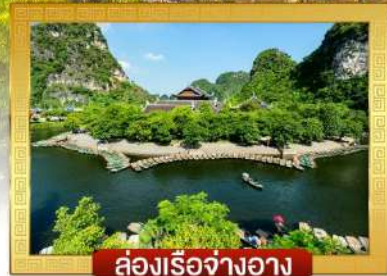
ต่องเรือจ้างอ่าง