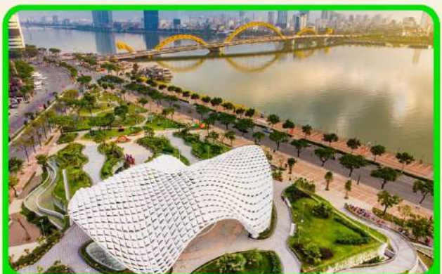
เช็คอิน แหล่งที่เที่ยวยุคใหม่ APEC PARK