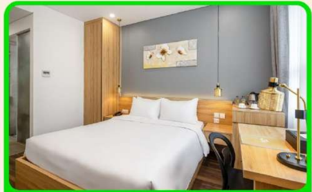
พักเมืองดานัง 4 ดาว 3 คืน