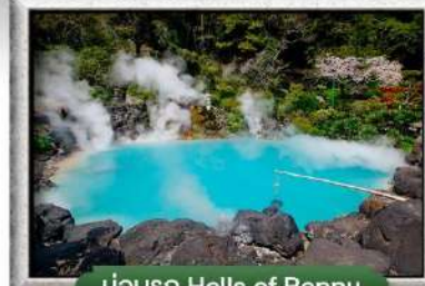
บ่อน้ำ Hells of Beppu