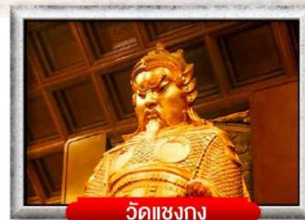
วัดแห่งงก