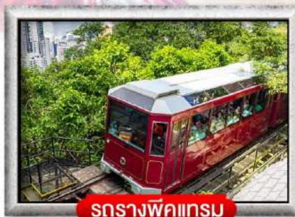
รถรางพิกแตรม