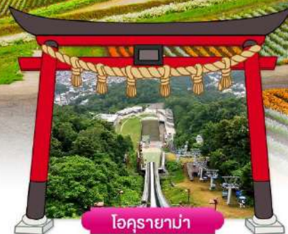
โอคุรายาม่า