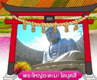
พระใหญ่อะตะมะ ไดบุตสึ