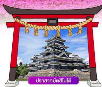
ปราสาทมัตสึโมโด้