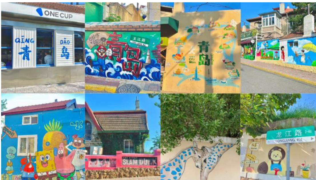
GO1CNXTAO-MU001 บินตรงเชียงใหม่ จิบเบียร์..ชมเมือง..ชิงเต่า..ฟิลยุโรป 5 วัน 4 คืน (MU)

ก้าวสู่โลกการ์ตูน สำรวจ ถนนการ์ตูน มियाซากิ ในมุมหนึ่งของเมืองชิงเต่าที่เต็มไปด้วยเสน่ห์ของสถาปัตยกรรมยุโรป มีตรอกซอกซอยที่ราวกับหลุดออกมาจากโลกแห่งจินตนาการของสตูดิโอจิบลิ เป็นชื่อเรียกที่นักท่องเที่ยวตั้งให้กับย่านถนนหลงเจียง และบริเวณใกล้เคียง กำแพงสองข้างทางถูกแต่งแต้มไปด้วยภาพวาดจากอนิเมะเรื่องดัง ไม่ว่าจะเป็นโทโทโร่เพื่อนรัก, Spirited Away หรือ ลากูนต้า พลิกตำนานเหนือเวทมนตร์ กลเลอรี่กลางแจ้งที่ผสมผสานศิลปะเข้ากับชีวิตประจำวันได้อย่างลงตัว ดึงดูดผู้ที่ชื่นชอบการถ่ายภาพและผู้ที่ใช้หลงใหลในโลกของจิบลิให้ต้องมาเยือน บรรยากาศของย่านนี้เต็มไปด้วยความโรแมนติกและกลิ่นอายของศิลปะ