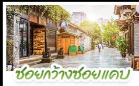
ชอยกว้างชอยแคบ