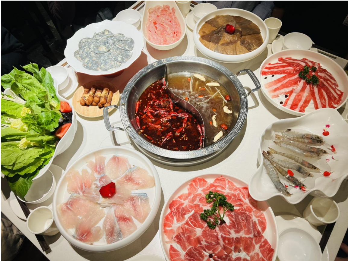
คำ รับประทานอาหารค่ำ ณ ภัตตาคาร (มื้อที่ 9) *เมนูพิเศษ สุกีหม่าล่าเสฉวน