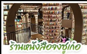
ร้านหนังสือจูก่อ