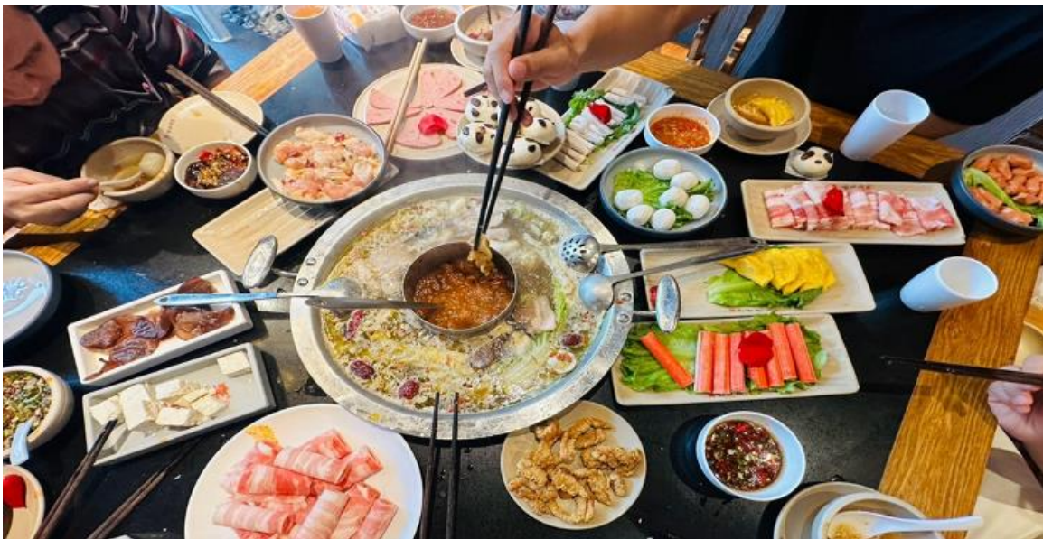
คำ รับประทานอาหารคำ ณ ภัตตาคาร (มื้อที่ 12) *เมนูพิเศษสุกี้หม่าล่าเสฉวน